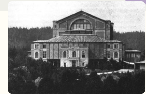
バイロイト祝祭劇場(1882年)

ウラディーミル・ホロヴィッツ(1903~1989) ドミトリー・ショスタコーヴィチ(1906~1975) ヘルベルト・フォン・カラヤン(1908~1989) ジョン・ケージ(1912~1992) レナード・バーンスタイン(1918~1990) 武満徹(1930~1996)