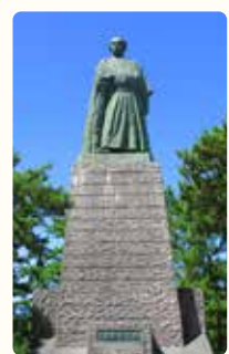
坂本龍馬像(高知県の柱浜)

1866 坂本龍馬(1836~1867)が仲介役となって倒幕のための薩長同盟が結ばれる。 1868 明治維新により首都が東京に移る。 1885 内閣制度が敷かれ、伊藤博文が初代首相となる。 同じころ、鹿鳴館時代が訪れて西洋文化が輸入される。