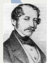
ウィーン・フィルハーモニー管弦楽団の創設者、オットー・ニコライ

1842 現在のウィーン・フィルハーモニー管弦楽団が第1回目のコンサートを開催 グスタフ・マーラー(1860~1911) クロード・ドビュッシー(1862~1918) リヒャルト・シュトラウス(1864~1949) ジャン・シベリウス(1865~1957) セルゲイ・ラフマニノフ(1873~1943) モーリス・ラヴェル(1875~1937)