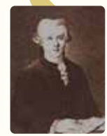
楽団のリーダーを務めてきたヨハン・フリードリヒ・ドーレス

古典派音楽 18世紀前期~19世紀前期 フランツ・ヨーゼフ・ハイドン(1732~1809) 1743 最古の民間オーケストラと伝えられるライプツィヒ・ゲヴァントハウス管弦楽団が、第1回目のコンサートを開催 ヴォルフガング・アマデウス・モーツァルト(1756~1791) ルートヴィヒ・ヴァン・ベートーヴェン(1770~1827) ジョアッキーノ・ロッシニ(1792~1868) フランツ・シューベルト(1797~1828)