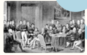
ウィーン会議の様子