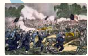
ゲティスバーグの戦い

1861 アメリカで南北戦争が始まる(1865) 1877 トマス・エジソン(1847~1931)が蓄音機を発明する