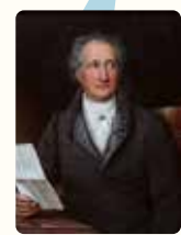
70歳のゲーテの肖像

1760年代 イギリスで産業革命が始まり、その後は各国も追従する。 1776 アメリカが独立宣言を公布する。 1789 フランス革命が起こる(1799)。 マリ・アントワネット(1755~1793)が処刑される。