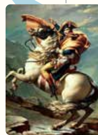
ダヴィッド 『アルプス越えのナポレオン』

1760年代 イギリスで産業革命が始まり、その後は各国も追従する。 1776 アメリカが独立宣言を公布する。 1789 フランス革命が起こる(1799)。 マリ・アントワネット(1755~1793)が処刑される。